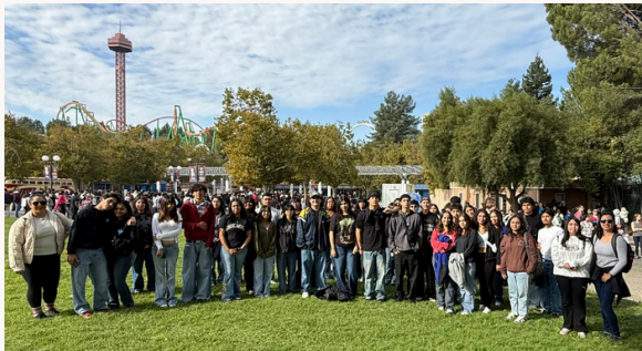
50 halcones celebrando el ir a la escuela todos los días a tiempo.