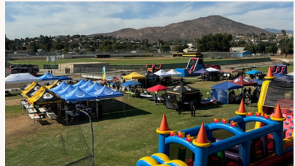
Vista Aérea: ¡Preparándonos para comenzar la diversión!