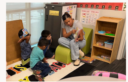
Compañeros de lectura en acción en Ina Arbuckle