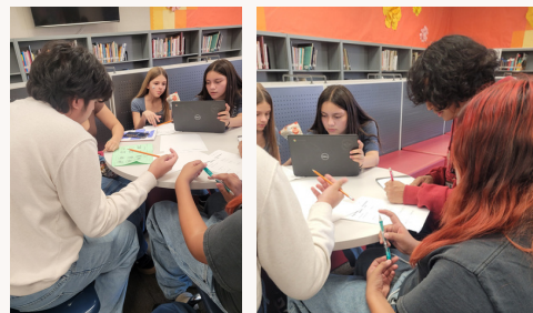
Alumnos de matemáticas ayudan con la tutoría en Mission Middle School

¡Todos pueden beneficiarse de una mano amiga con las matemáticas! Los alumnos de matemáticas de RHS comenzaron a dar clases particulares en MMS además de en RHS. Juntos, #SubiendoDeNivel como comunidad.