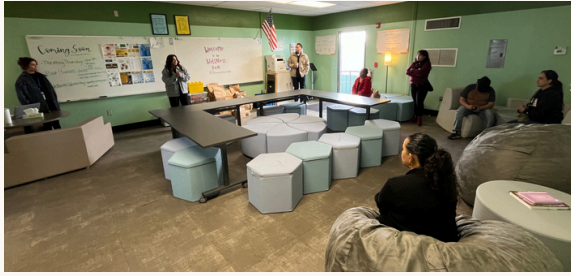
Padres de ELAC visitando el Centro de Bienestar