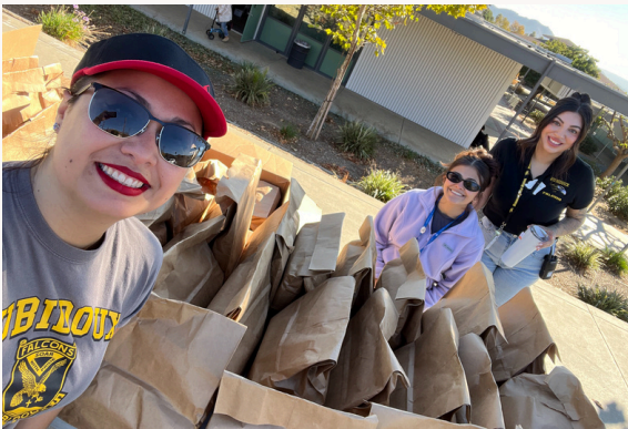
Nuestro personal del centro de bienestar en el frente de la escuela distribuyendo bolsas de comida.

Un agradecimiento especial a Kidz Come First por donar alimentos para nuestro sexto evento anual de distribución de alimentos del Día de Acción de Gracias.