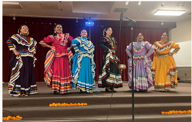
Grupo folklórico actuó en el Festival del Día de Muertos de la Escuela Secundaria Mira Loma.

A nuestra clase de Folklorico le encanta compartir con la comunidad lo que han aprendido sobre su cultura. ¿Te interesa la clase? ¡Pregúntale a tu consejero!