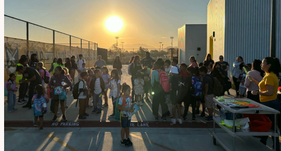
Los estudiantes y el personal se reunieron en RHS para disfrutar del amanecer antes de caminar hacia la escuela.

Fue muy divertido asociarnos con Rustic Lane para su día anual de caminata a las escuelas