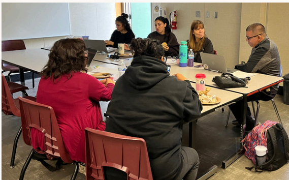
Personal analizando y sintetizando datos