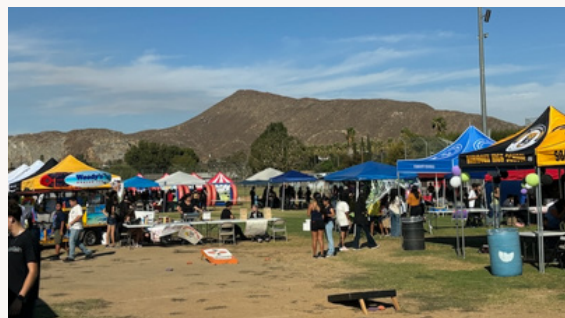
Festival del Halcón, reuniendo a todos los halcones y sus familias para pasar un buen rato.